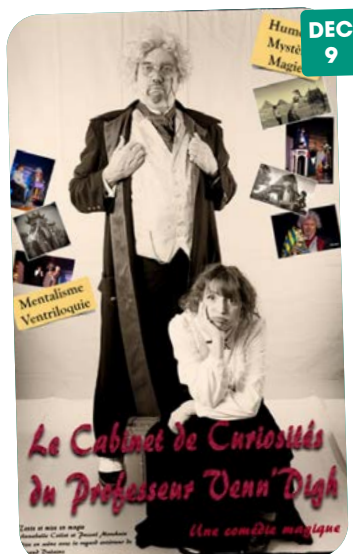
L'amicale offre un spectacle de magie et d'illusion, aux enfants de l'école le vendredi 9 décembre