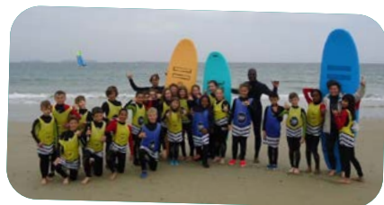
Classe de mer Perros Guirec financée en grande partie par l'Amicale