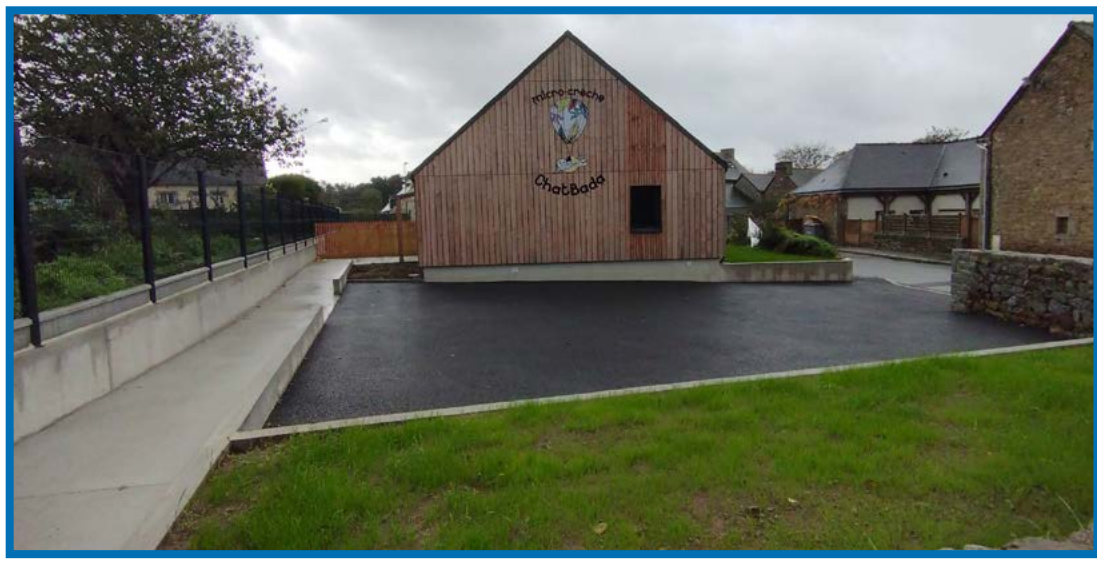
Aire de jeux pour enfants de 3 à 12 ans ouverte depuis les vacances de la Toussaint, à côté du City Park

La micro-crèche est privée, le parking est communal avec la réalisation de 2 places PMR.