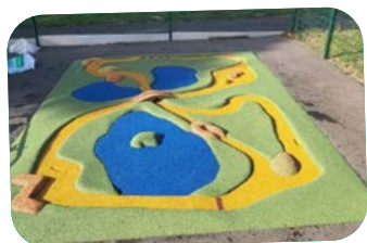
Achat circuit de billes / petites voitures pour la cour de l'école