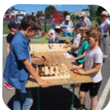
Achat de jeux en bois