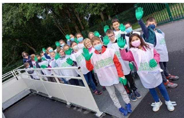
Les élèves de l'école

Nous avons constaté qu'il y avait moins de déchets que l'année dernière.