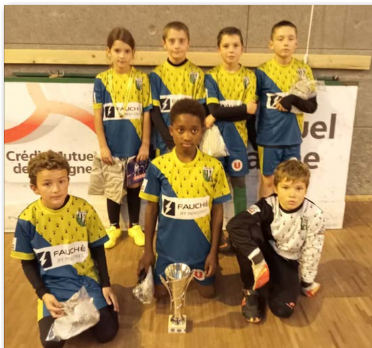
Équipe U11 en finale du tournoi