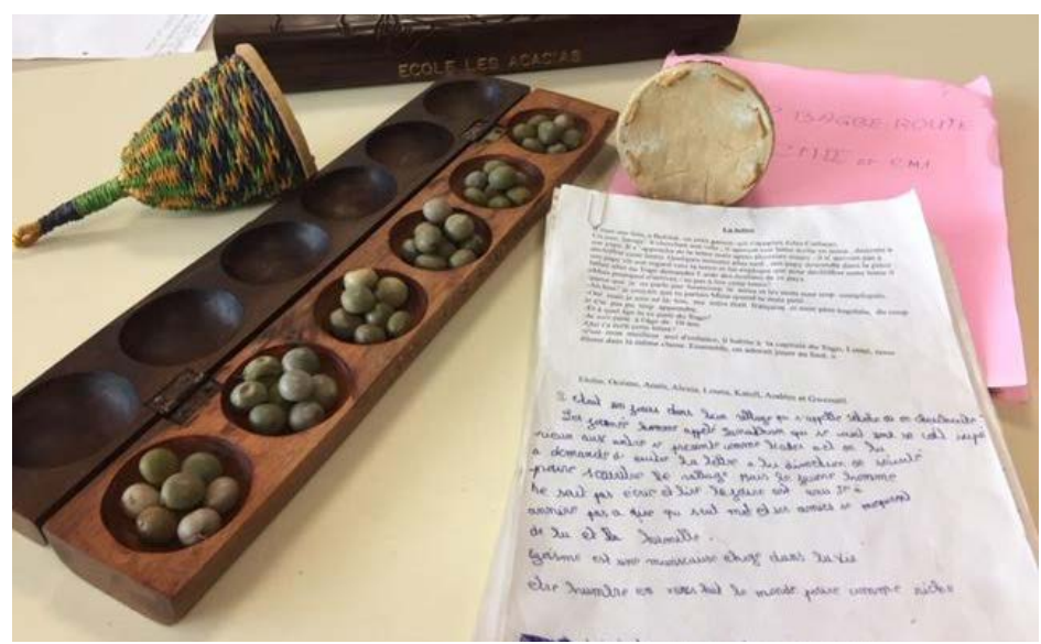
Les CM1-CM2 de l'école des Acacias.