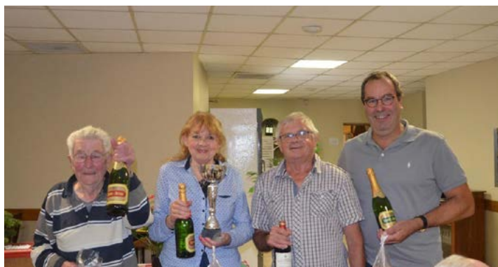
Les gagnants du challenge